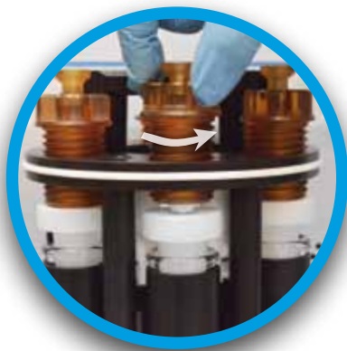
Fácil cierre de las tapas de los tubos