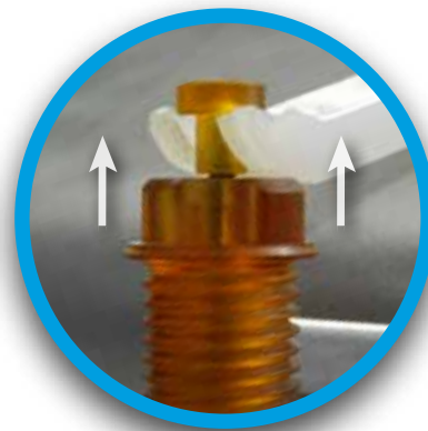
Rápido enfriamiento y ventilación segura

Cuando la digestión de las muestras está completada, el módulo de aire comprimido se activa para enfriar las muestras rápidamente (ver tabla). Por ejemplo, enfriar una muestra de 10 ml. desde 180 °C hasta 70 °C toma solo 3.4 minutos. Del mismo modo, enfriar una muestra de 50 ml. desde 180 °C hasta 70 °C toma 4.3 minutos. Estas pruebas de laboratorio confirman los óptimos tiempos de enfriamiento de muestras dando como resultado el tiempo de respuesta más rápido del mercado (usando presión de 5 atm.).