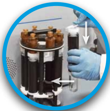
Sencillo de instalar